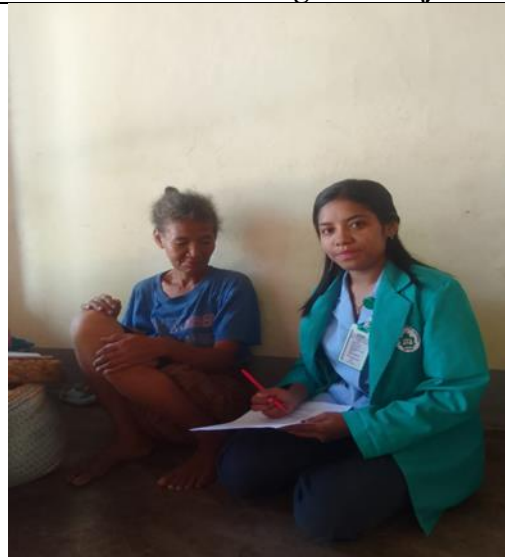
Gambar 8 Wawancara dengan lansia