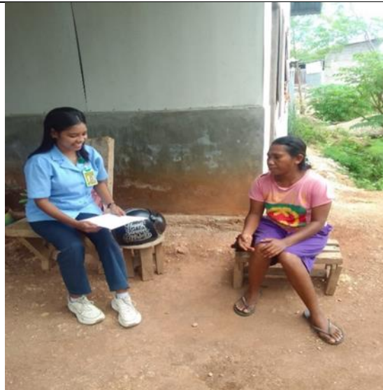
Gambar 7 Wawancara dengan dewasa