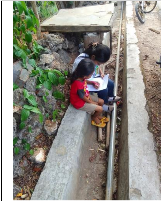
Gambar 5. Wawancara dengan anak-anak