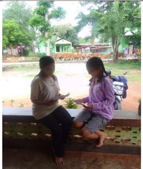
Gambar 6. Wawancara dengan remaja