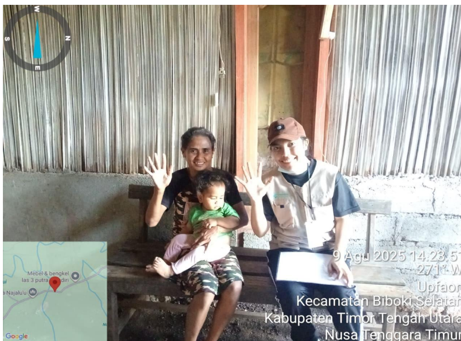
Dokumentasi Survei penerapan pengelolaan air minum dan makanan rumah tangga di Desa Upfaon.