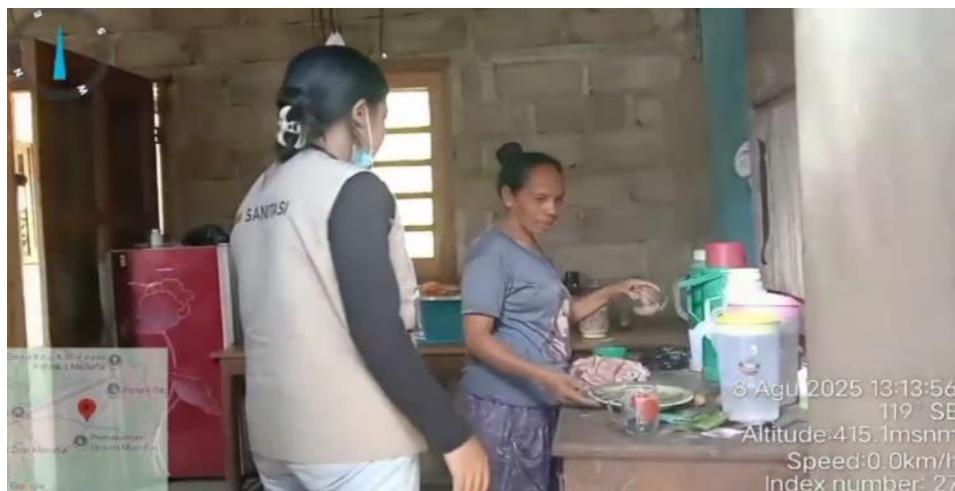
Dokumentasi kategori penerapan pengelolaan air minum dan makanan rumah tangga di Desa Upfaon.