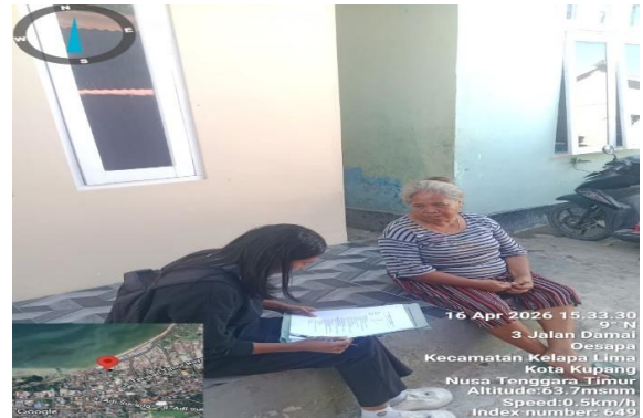
Survey tingkat pengetahuan responden (wawancara)