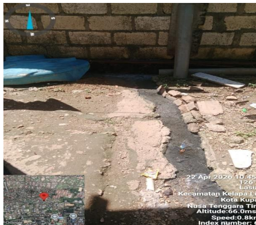
Air limbah dari buangan mencuci yang mengalir di permukaan tanah