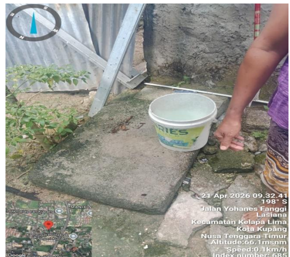
Saluran pembuangan limbah kedap tertutup