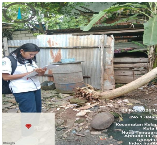
Observasi tindakan pengamanan limbah cair rumah tangga (ada genangan air limbah)