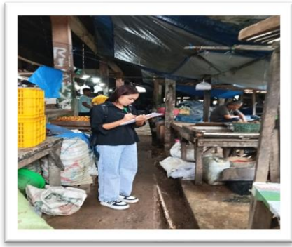
Pengamatan Pengamanan Limbah Cair di Pasar Oebobo