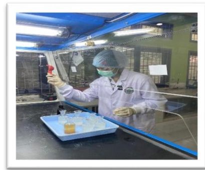
Pemeriksaan Sampel BOD Untuk Pengujian Kedua di Laboratorium