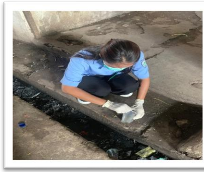
Pengambilan Sampel BOD di Pasar Oebobo