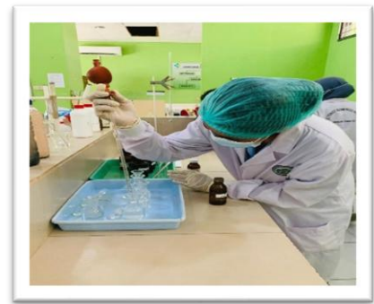
Pemeriksaan Sampel BOD Pengujian Pertama di Laboratorium Kimia