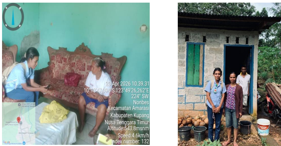
Pengamatan jenis sarana CTPS