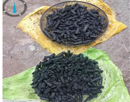
Proses Penjemuran Karbon aktif bunga lontar