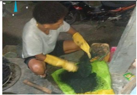
Proses Menghancurkan dan Penyaringan Karbon aktif bunga lontar