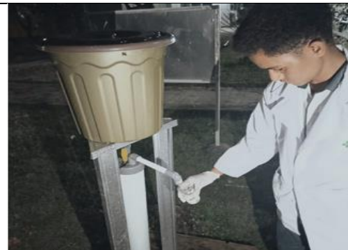
Proses Pengambilan sampel pengolahan kedua