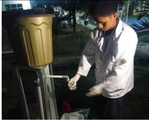
Proses Pengambilan sampel pengolahan ketiga