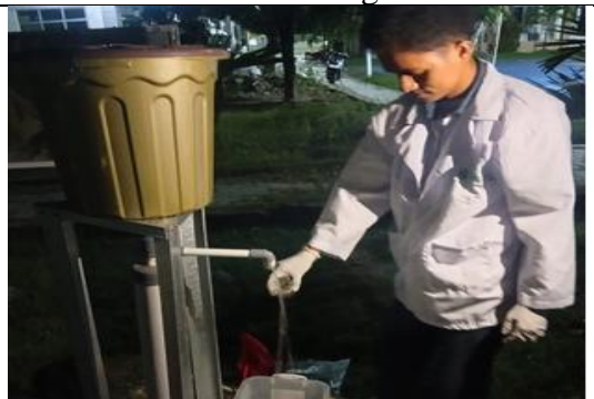
Proses Pengambilan Sampel Pengolahan Pertama