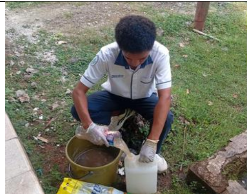
Proses Pembuatan Sampel kekeruhan