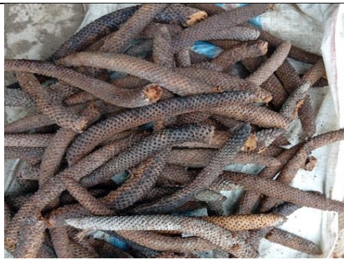
Penjemuran bunga lontar