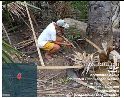
Pengambilan bunga lontar