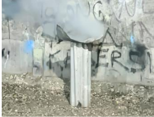
Proses Pembakaran bunga lontar