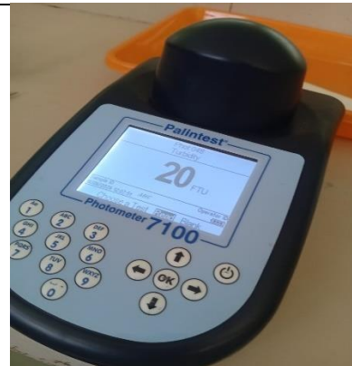
Hasil pemeriksaan laboratprium sampel Setelah Pengolahan pertama