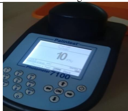
Hasil pemeriksaan laboratprium sampel Setelah Pengolahan kedua