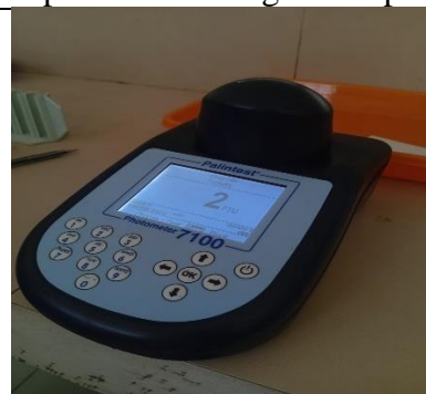
Hasil pemeriksaan laboratprium sampel Setelah Pengolahan ketiga