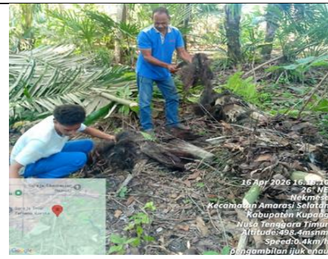
Pengambilan Ijuk Enau