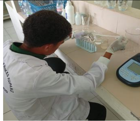
Proses Pemeriksaan sampe di Laboratorium Kimia