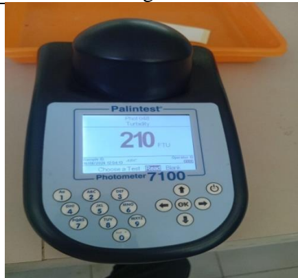
Hasil pemeriksaan laboratprium sampel Sebelum Pengolahan