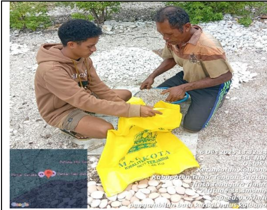
Pengambilan kerikil Kolbano