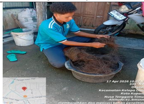
Proses Pencucian Ijuk Enau