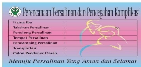
Gambar 5 stiker P4K (Program Perencanaan Persalinan Dan Pencegahan Komplikasi)