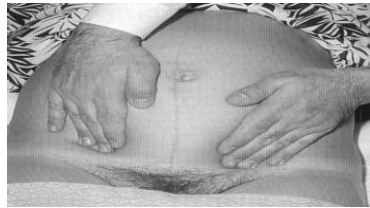
Gambar 4 Leopold IV

Posisi tangan masih bisa bertemu, dan belum masuk PAP (konvergen), posisi tangan tidak bertemu dan sudah masuk PAP (divergen). Tujuan : untuk mengetahui seberapa jauh masuknya bagian terendah jading kedalam PAP (Romauli, 2011).