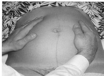
Gambar 2 Leopold II

Normalnya teraba bagian panjang, keras seperti papan (punggung) pada satu sisi uterus dan pada sisi lain teraba bagian kecil. Tujuan : untuk mengetahui batas kiri/kanan pada uterus ibu, yaitu: punggung pada letak bujur dan kepala pada letak lintang (Romauli, 2011).