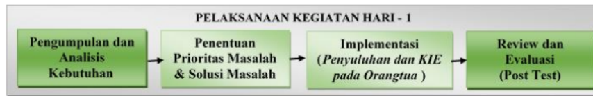
Gambar 3.1 Pelaksanaan Kegiatan Pengabdian Masyarakat

Pelaksanaan kegiatan digambarkan dalam skema dibawah ini: