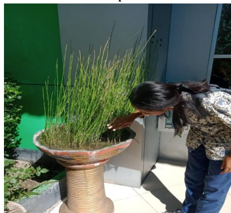
Survei jentik Aedes sp di luar gedung Kampus C