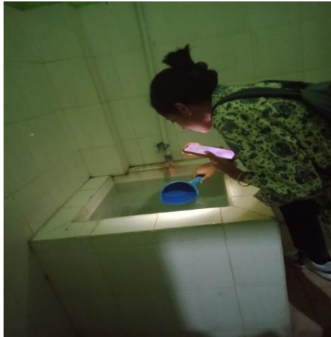
Survei jentik Aedes sp di dalam gedung Kampus A