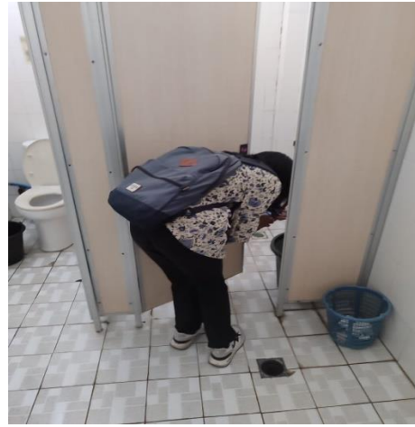
Survei jentik Aedes sp di dalam gedung Kampus B