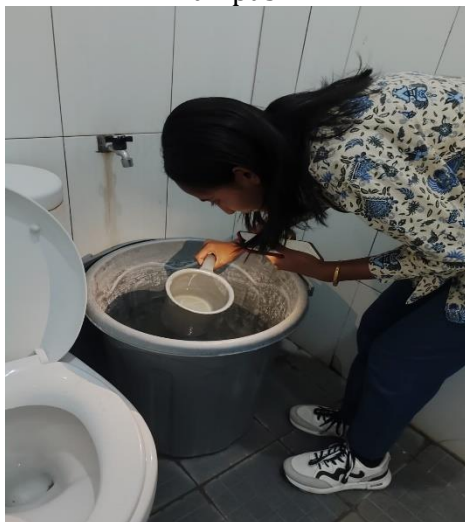
Survei jentik Aedes sp di dalam gedung Kampus C