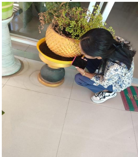
Survei jentik Aedes di luar gedung Kampus A