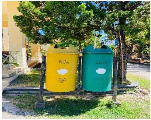
Pemeriksaan Kondisi Tempat Sampah Gereja