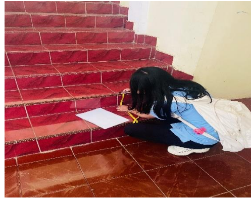
Pengukuran Tangga Gereja