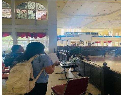
Pemeriksaan Kondisi Bangunan Gereja