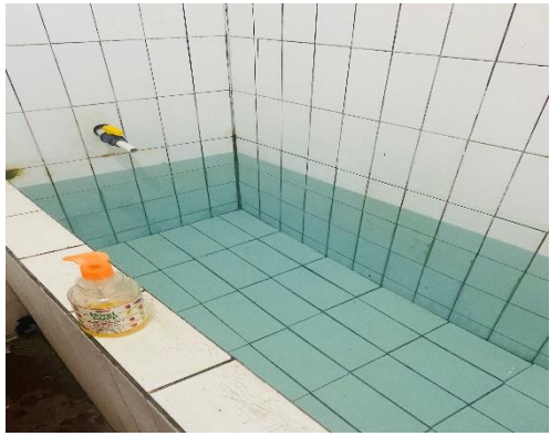
Pemeriksaan Kondisi Ketersediaan Air Gereja