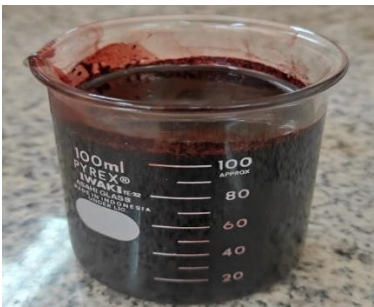
f. Pembuatan konsentrasi ekstrak kuncup daun jati