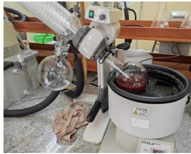
e. Ekstrak kental kuncup daun jati hasil evaporasi