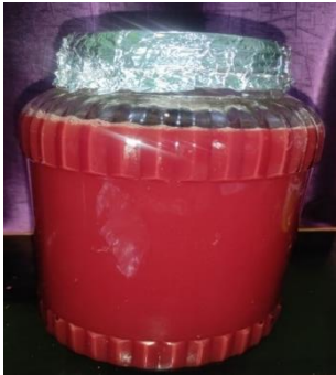
d. Proses evaporasi hasil rendeman kuncup daun jati