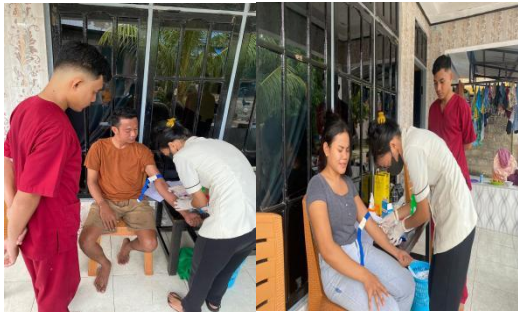
Pengerjaan Di Lab