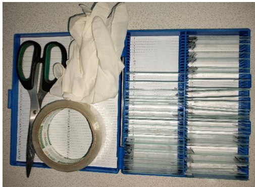
Alat dan bahan