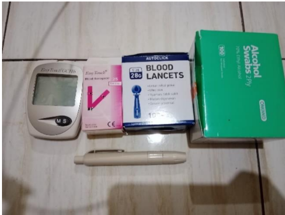
Gambar 2. Alat dan Bahan Pemeriksaan Kadar Hemoglobin