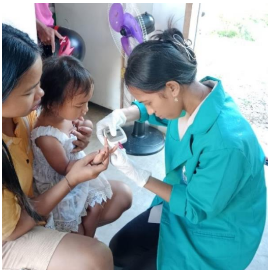
Gambar 3. Pemeriksaan Kadar Hemoglobin