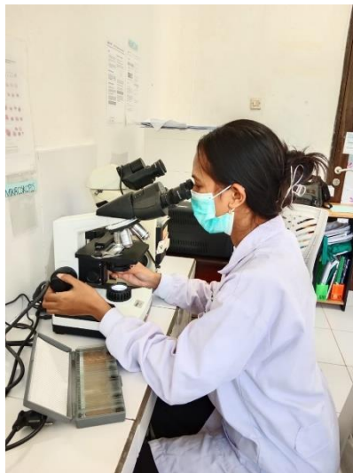
Gambar 5. Pemeriksaan Enterobius vermicularis