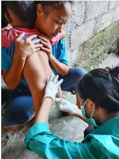
Gambar 4. Pengambilan Sampel Kecacingan