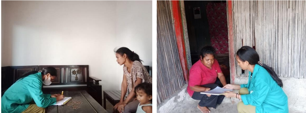
Gambar 1. Pengisian Lembar Persetujuan Menjadi Responden