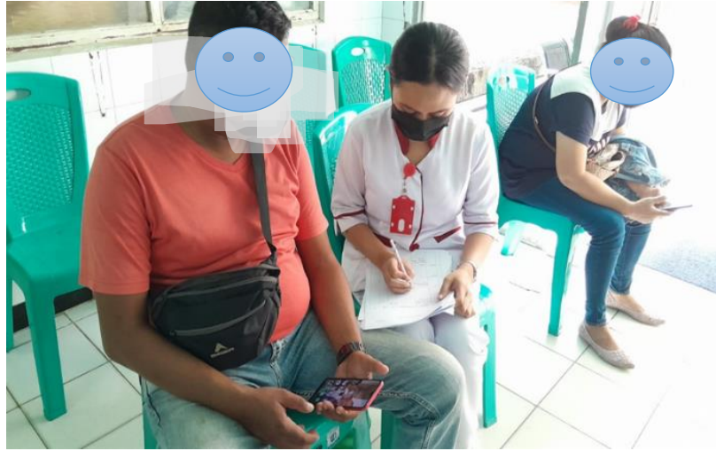
Wawancara Recall asupan makanan