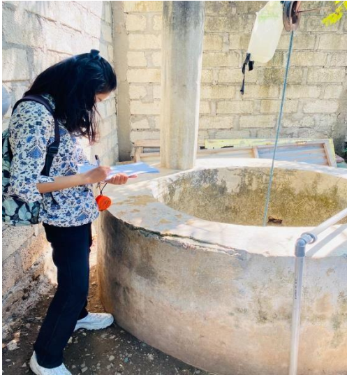
Inspeksi sumur gali di Kelurahan Oesapa