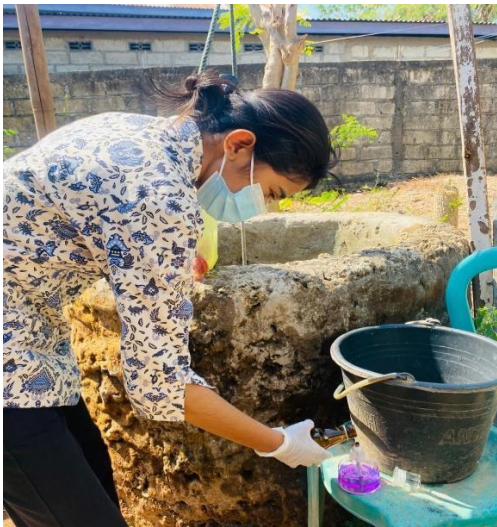
Pengambilan sampel air sumur gali