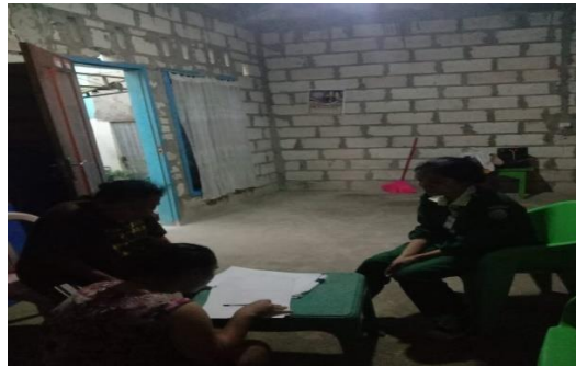
Penyerahan kuisisioner penelitian kepada ibu balita di kelurahan Oesapa, kec. Kelapa Lima Kota Kupang