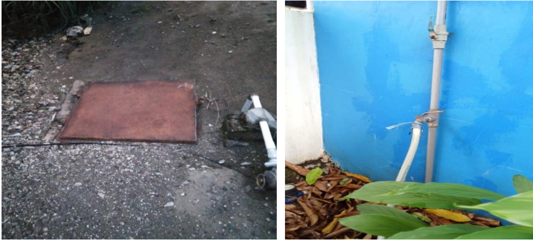
Gambar 4. Dokumentasi tutup bak yang menhole, tutupqn yang kotor dan kran air di RT/RW 005/002 Kelurahan Oesapa Selatan.