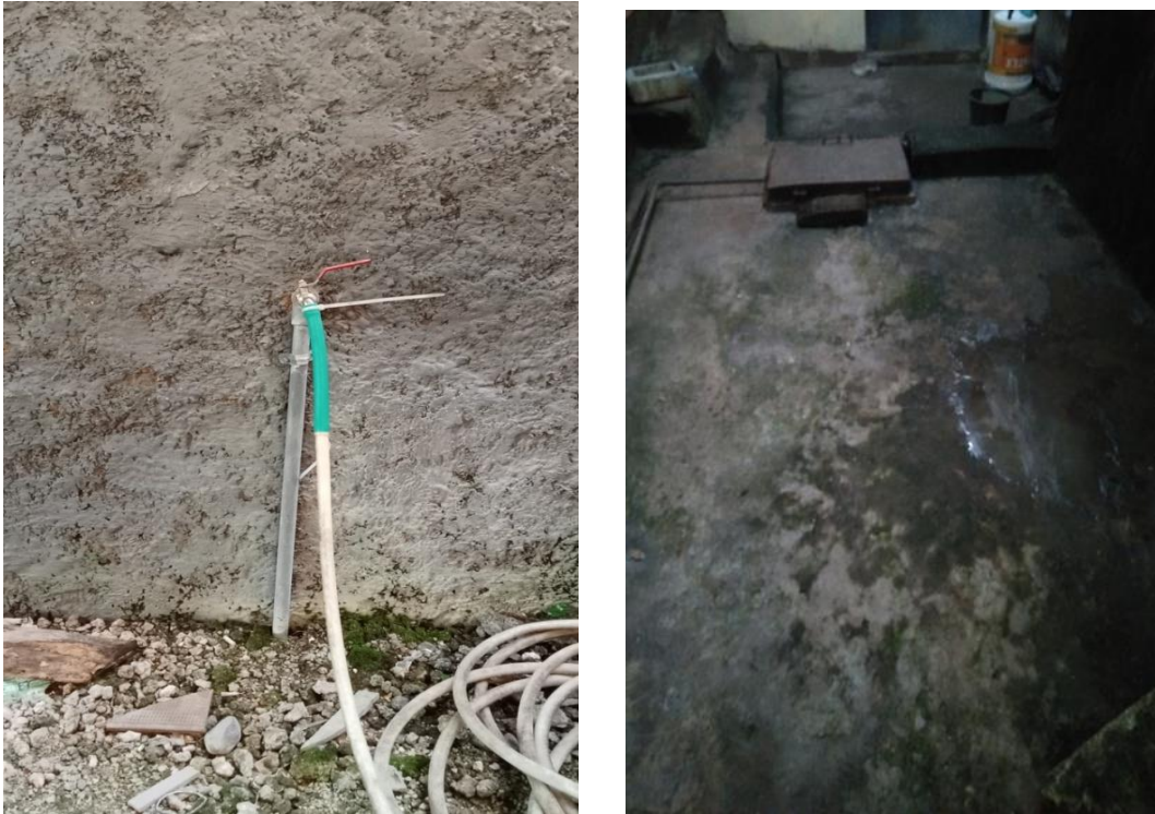
Gambar 5. Hasil dokumentasi kran luar rumah yang tidak berpagar dan bakpenampung di RT/RW 005/002 Kelurahan Oesapa Selatan.