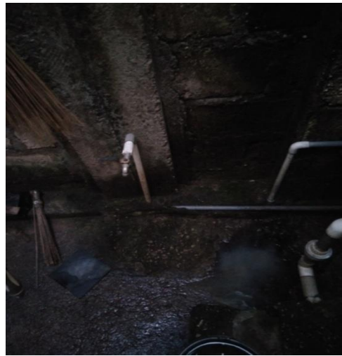
Gambar 1. Dokumentasi baak penampung dan genangan air didekat baak penampung di RT/RW 005/002 Kelurahan Oesapa Selatan.