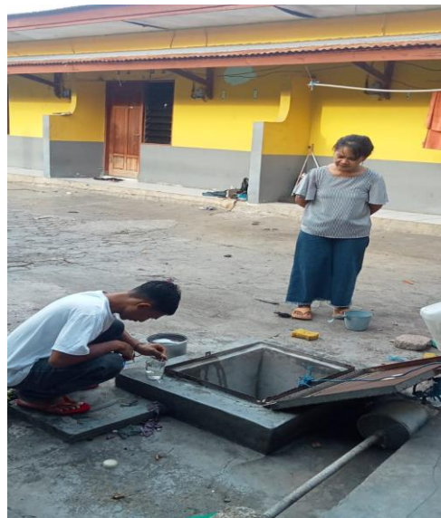
Gambar 2. Dokumentasi proses pengambilan air PDAM untuk pengukuran ph di RT/RW 005/002 Kelurahan Oesapa Selatan.